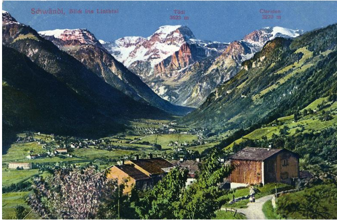
Schwändi um 1920