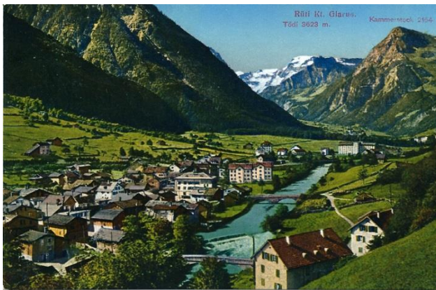
Rütli um 1920